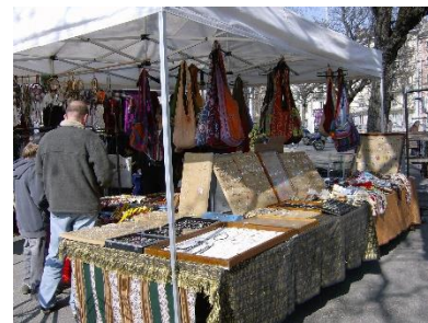
le marché aux puces