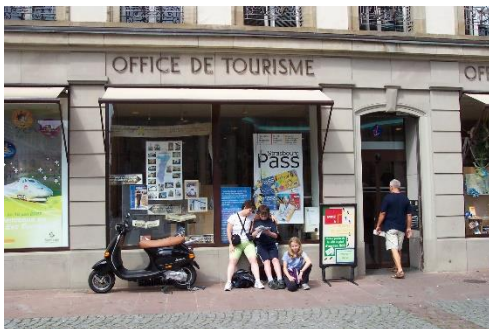
l' office de tourisme