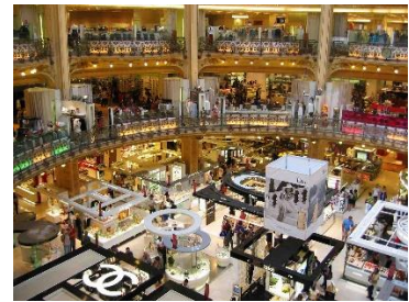
les Galeries (Lafayette)