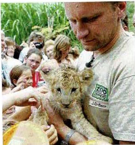
Ein Tierpfleger trägt das Löwenjunge Malik.